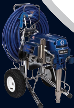
MARK VII™ MAX PLATINUM