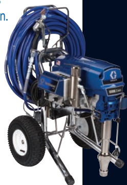
MARK X™ MAX PLATINUM

A jól bevált megoldásokat – pl. ProConnect™ egyszerű szivattyúcsere, QuikReel™ tömlőrendszer, E-control vezeték nélküli nyomásszabályozás és FastFlush tisztítórendszer – alkalmazó modellek a legjobbnak számítanak a kompakt elektromos airless festék- és glettszóró berendezések piacán. És igen, a korábnál 15 méterrel több, vagyis 30 méter tömlő áll a felhasználók rendelkezésére, valamint hosszabb hajlékony tömlő, és rugós kitámasztó az egyszerű tartálycsere érdekében. MARK MAX Platinum sorozat; Az elektromos airless szóróberendezések etalonja