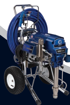
MARK V™ MAX PLATINUM