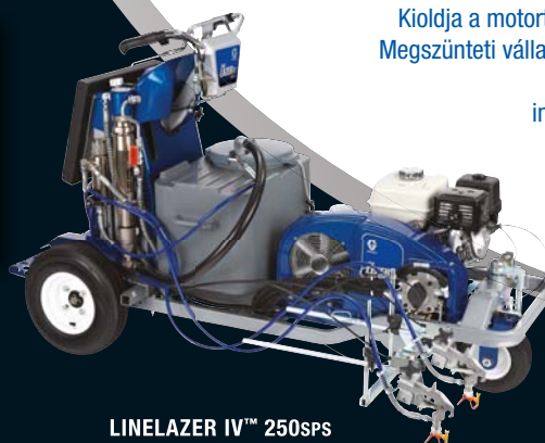
LINELAZER IV™ 250SPS

Kioldja a motort a gyors indítás érdekében. Megszünteti vállalkozók által legkeresettebb, új Honda® GX 270 motor indulásakor fellépő terhelést.